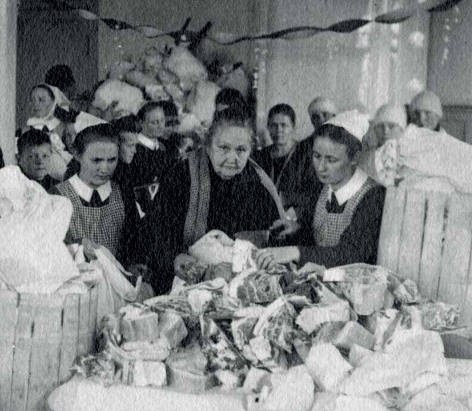
Mathjälpen var en viktig del av Stadsmissionens arbete. På bilden från 1929 packas köttpaket som ska delas ut till fattiga Helsingforsares julbord.